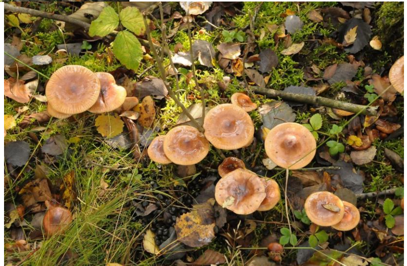
en de berkenridderzwam