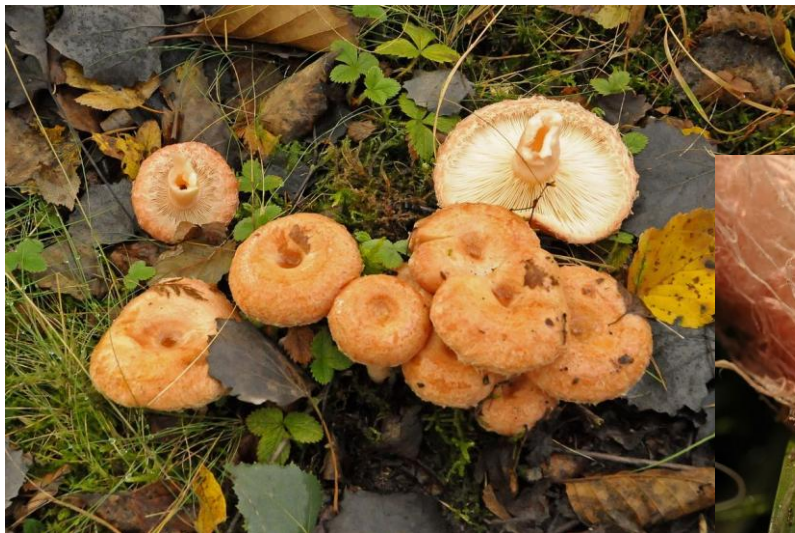
de baardige melkzwam