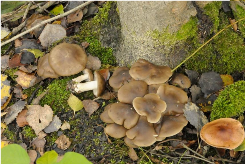
de bruine bundelridderzwam