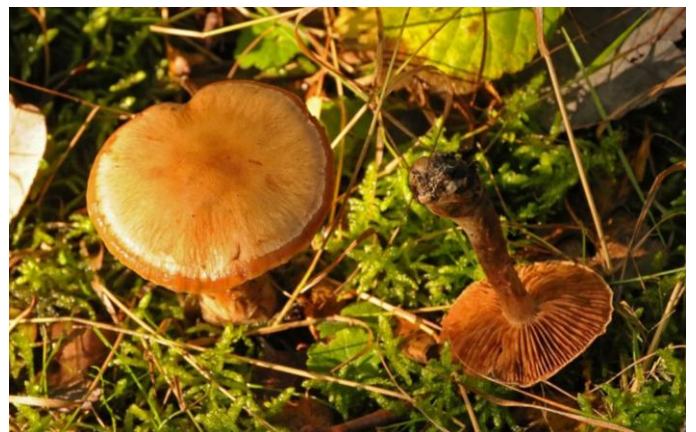
De roodbruine gordijnzwam