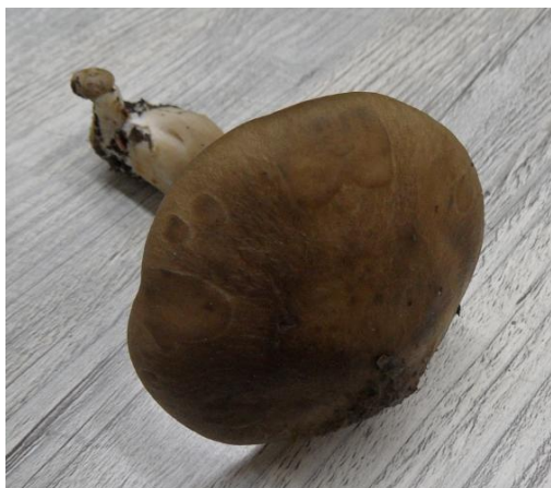
de bruine bundelridderzwam