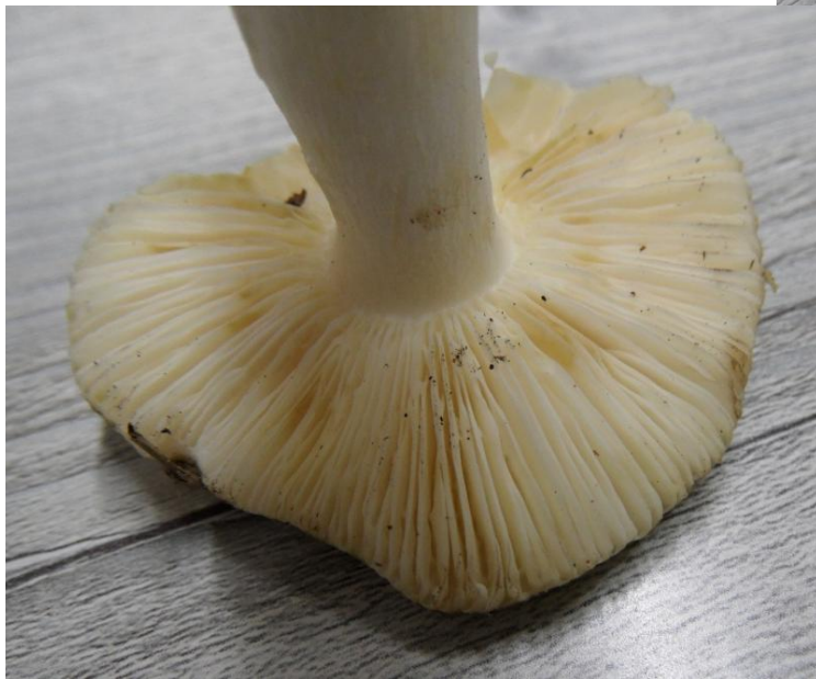
en de vorkplaatrussula