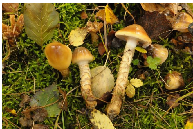
en de gegordelde gordijnzwam